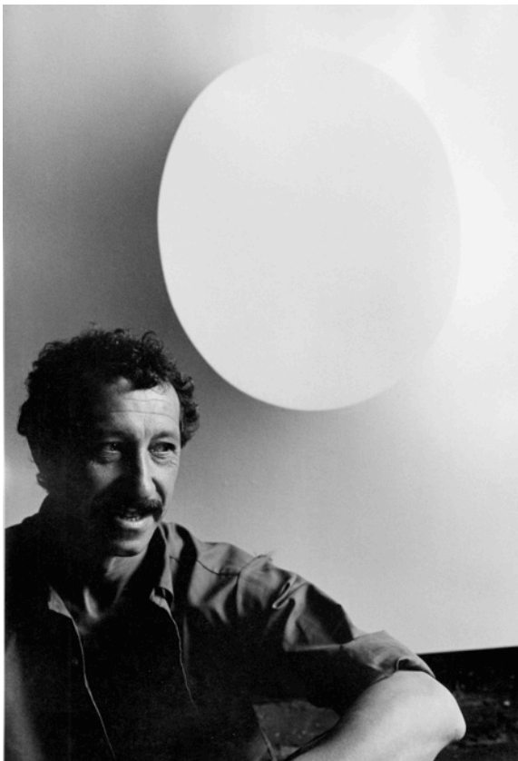
Turi Simeti lors de son private show à New York en 1968.