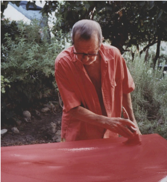
Turi Simeti dans son atelier milanais.

Exposition du 10 octobre au 20 décembre 2014 Brunch presse le jeudi 9 octobre de 12h à 15h