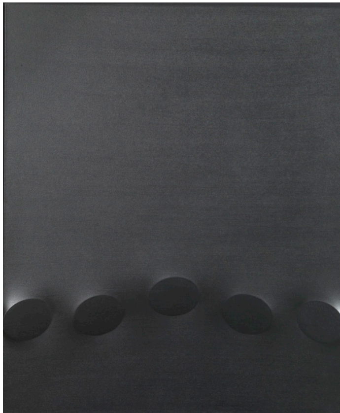
Turi Simeti, Cinque ovali neri , 2007. Acrylique sur toile extroflece, 100 x 120 cm