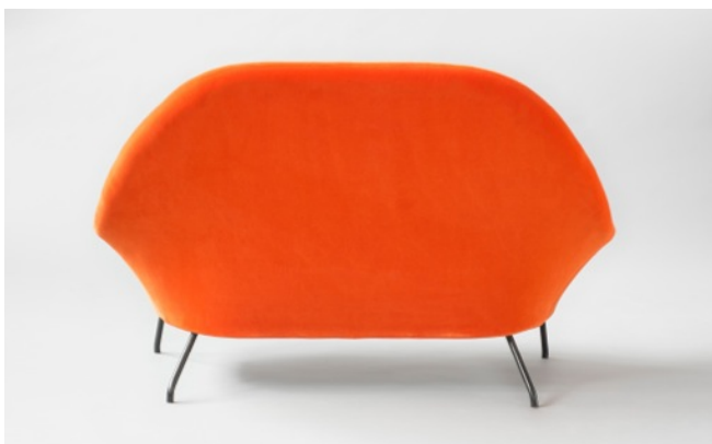
Banquette 772 , Joseph-André Motte. Edition Steiner 1958.