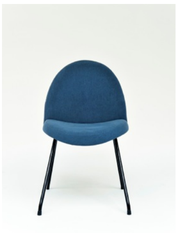
Chaise 771, bleue, Joseph-André Motte. Edition Steiner, 1957/58