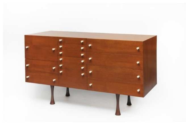
Commode Evelynne , Joseph-André Motte. Edition Charron, 1959.