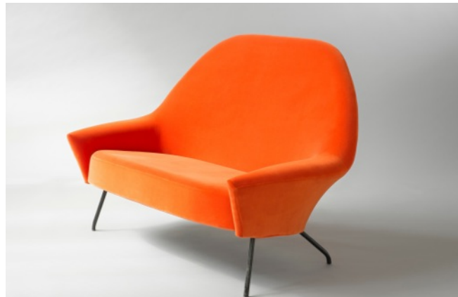
Banquette 772 , Joseph-André Motte. Edition Steiner 1958.