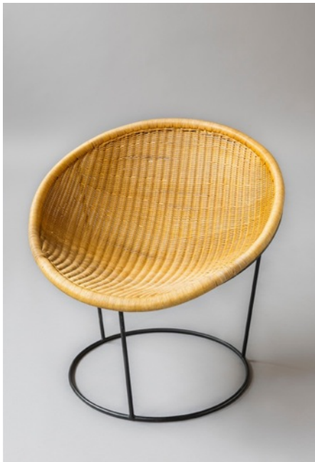
Fauteuil Catherine, Joseph-André Motte. Edition Rougier 1950.