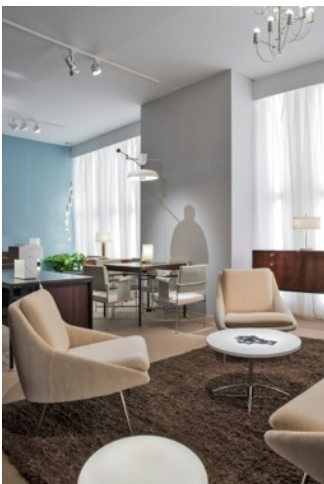
Stand de la galerie Pascal Cuisinier. PAD Paris 2013.