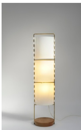
Lampadaire M1 , Joseph-André Motte. Edition Les Huchers, 1958.