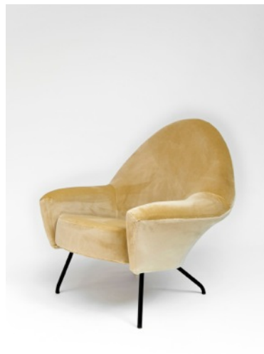
Fauteuil 770, Joseph-André Motte. Edition Steiner, 1958.