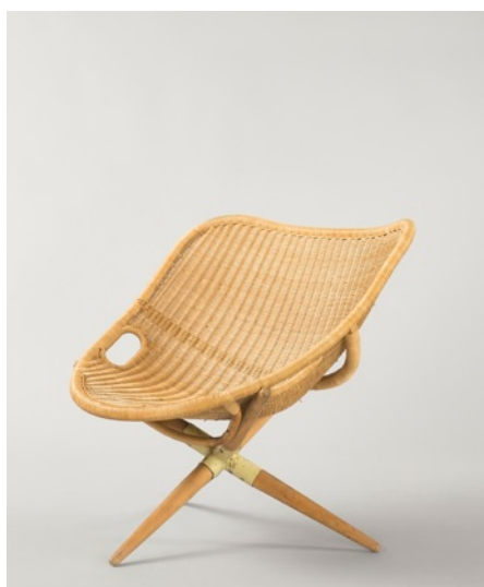
Fauteuil Tripode , Joseph-André Motte. Edition Rougier 1949.