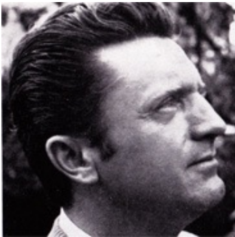
Joseph-André Motte, portrait.