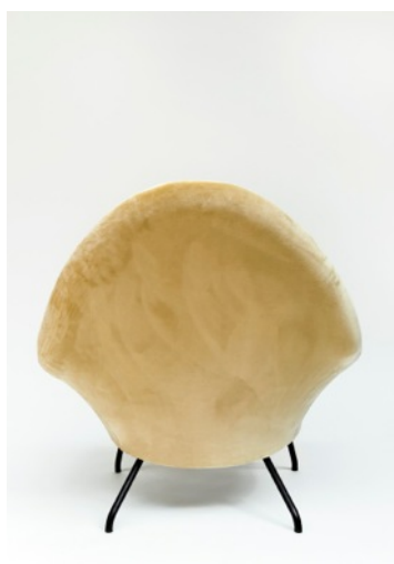
Fauteuil 770, Joseph-André Motte. Edition Steiner, 1958. Courtesy Galerie Pascal Cuisinier