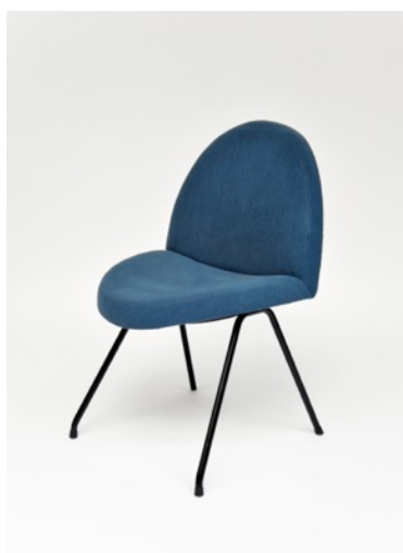
Chaise 771, bleue, Joseph-André Motte. Edition Steiner, 1957/58