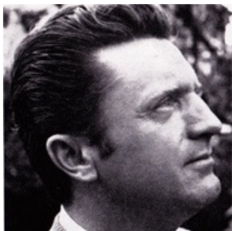
Joseph-André Motte, portrait.