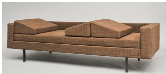
Canapé 900 , Joseph-André Motte. Edition Steiner, 1960.