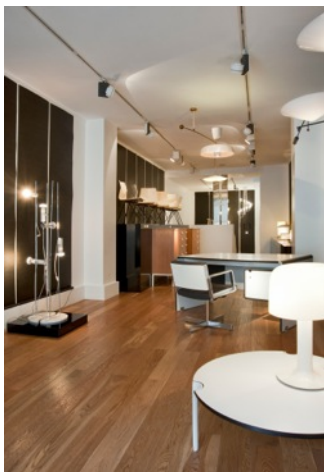
Vue de la galerie Pascal Cuisinier, Courtesy Galerie Pascal Cuisinier.

Pascal Cuisinier, vous avez travaillé pendant six ans sur une thèse en art plastiques et en philosophie. Quelle influence ces années de recherches ont-elles sur votre activité actuelle de galeriste ?