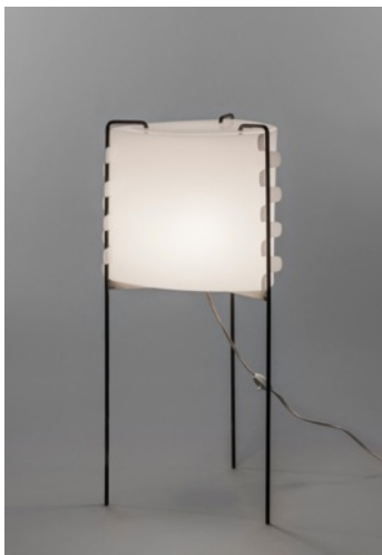
Lampadaire M4, Joseph-André Motte. Edition Les Huchers, 1958.