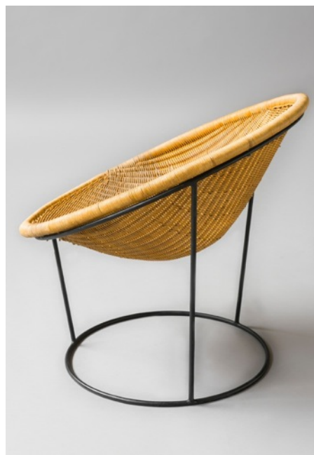
Fauteuil Catherine , Joseph-André Motte. Edition Rougier 1950.