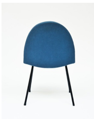
Chaise 771, bleue, Joseph-André Motte. Edition Steiner, 1957/58