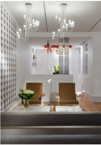
Vue de la galerie Pascal Cuisinier, Courtesy Galerie Pascal Cuisinier.