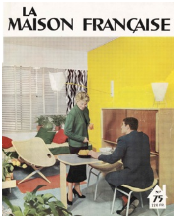
Maison Française, mars 1954