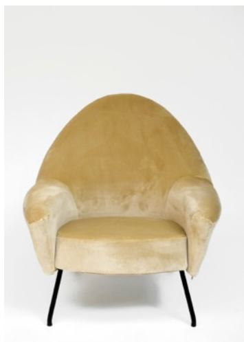
Fauteuil 770, Joseph-André Motte. Edition Steiner, 1958.