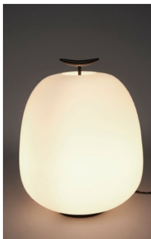
Lampe J13 Joseph-André Motte. Edition Disderot, 1957.