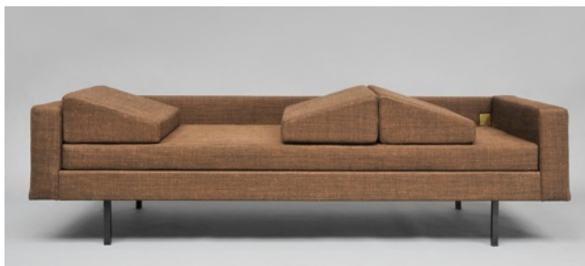
Canapé 900 , Joseph-André Motte. Edition Steiner, 1960.