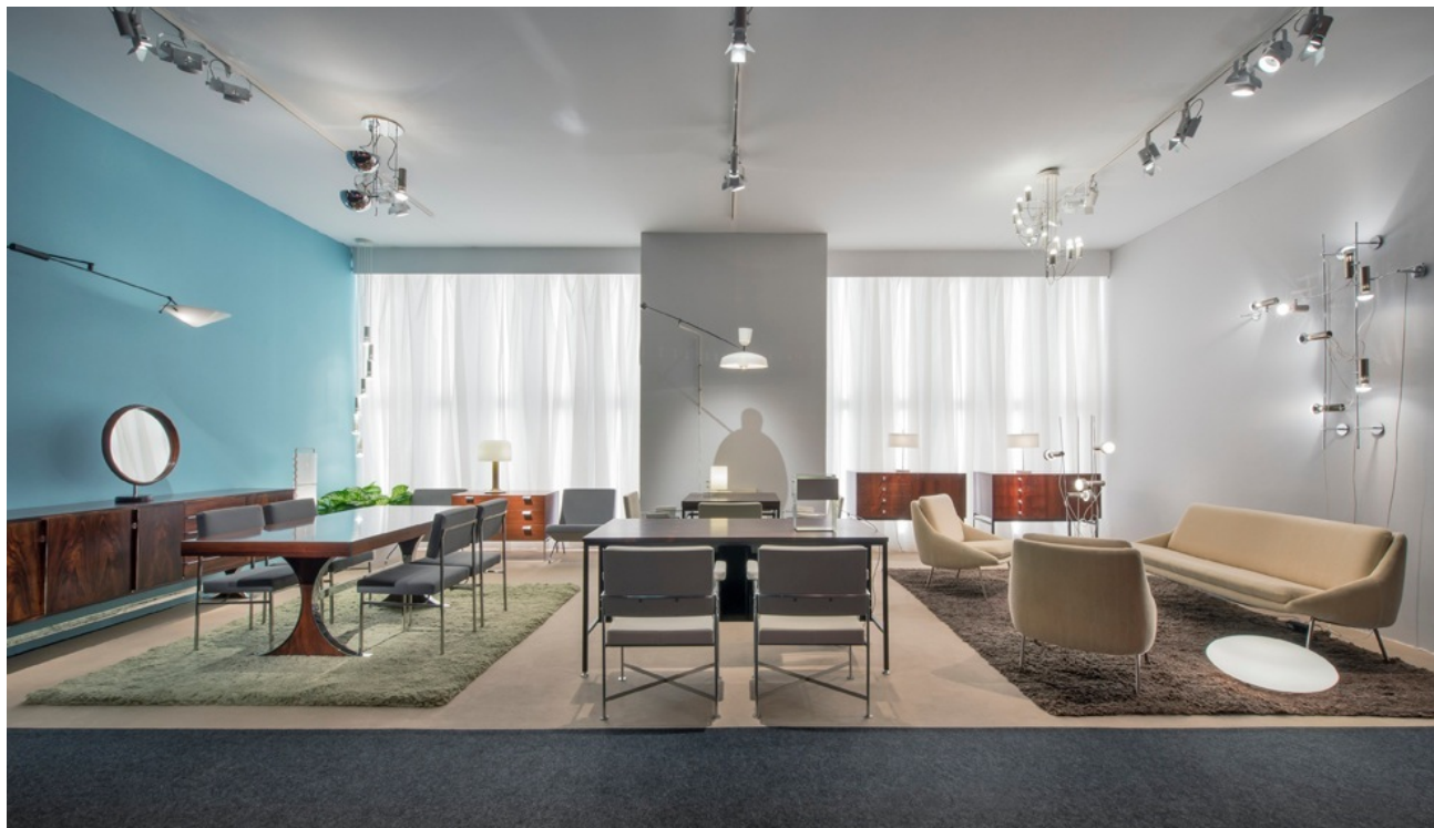
Sand de la galerie Pascal Cuisinier, PAD Paris 2013.

La Galerie Pascal Cuisinier défend depuis 2006 la génération des premiers designers français. Ces créateurs expriment l'ultra modernité du design du XXe siècle. Leur mobilier, conçu entre 1951 et 1961, en vue d'une édition en série, se caractérise par sa fonctionnalité, son innovation technique et l'élégance de son dessin.