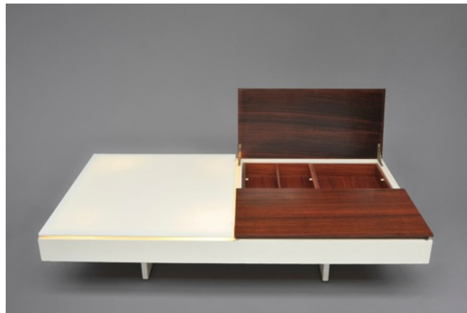
Table basse éclairante , Joseph-André Motte. Edition Charron, 1959.