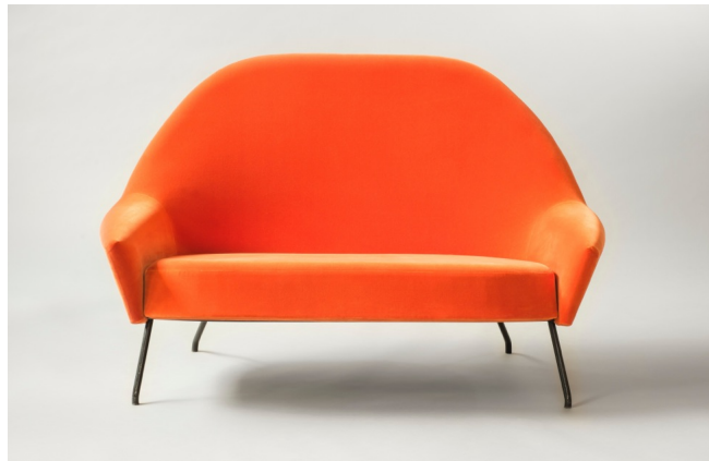
Banquette 772 , Joseph-André Motte. Edition Steiner 1958. Courtesy Galerie Pascal Cuisinier