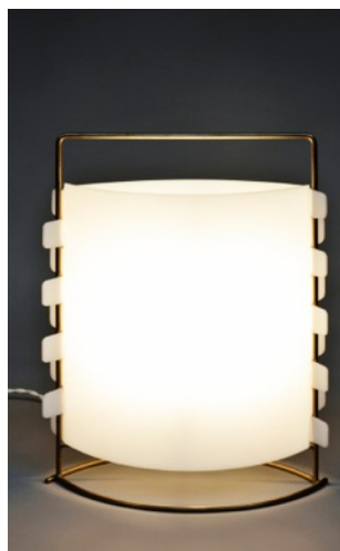
Lampe M5 Joseph-André Motte. Edition Les Huchers, 1958.