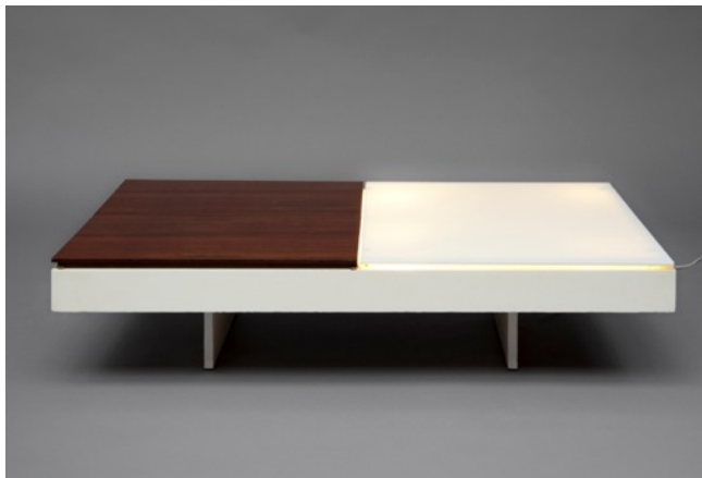
Table basse éclairante , Joseph-André Motte. Edition Charron, 1959.