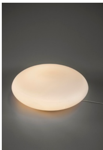
Lampe J10 Joseph-André Motte. Edition Verre Lumière, 1972.