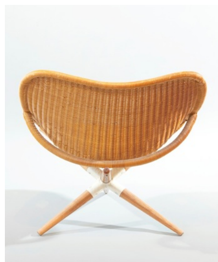
Fauteuil Tripode , Joseph-André Motte. Edition Rougier 1949.