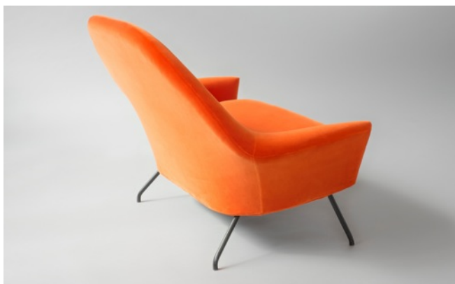
Banquette 772 , Joseph-André Motte. Edition Steiner 1958.