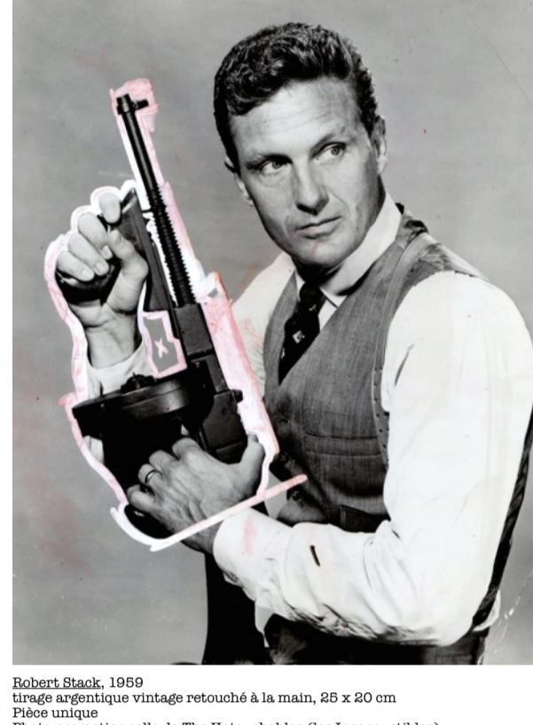
Robert Stack, 1959 tirage argentique vintage retouché à la main, 25 x 20 cm Pièce unique Photo promotionnelle de The Untouchables (Les Incorruptibles) Date de parution : 26 octobre 1959