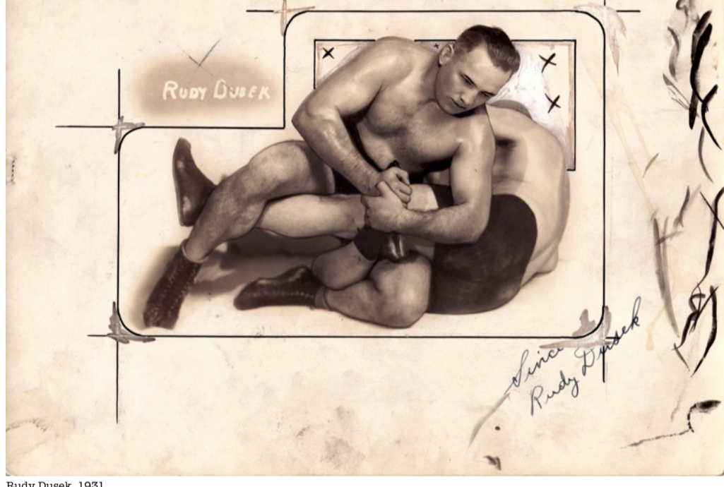
Rudy Dusek, 1931 tirage argentique vintage retouché à la main, 20 x 26 cm Pièce unique Au dos du cliché, daté du 21 janvier 1931

Cependant qu'il s'agisse de retouches manuelles visibles à l'oeil nu ou de retouches réalisées grâce à Photoshop aujourd'hui, l'idée reste la même : améliorer le visuel et son contenu, donner au lecteur la vision souhaitée et préalablement décidée.