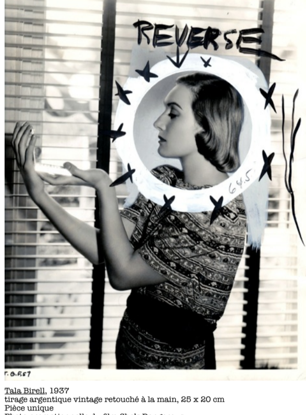
Tala Birell, 1937 tirage argentique vintage retouché à la main, 25 x 20 cm Pièce unique Photo promotionnelle du film She's Dangerous

La galerie Argentic présentera du 3 avril au 20 juin 2015, des photographies de presse retouchées à la main, issues de la collection du réalisateur Raynal Pellicer.