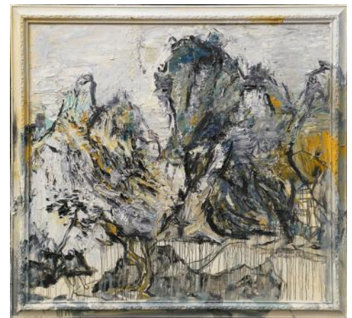
En haut à droite CŒuvre abstraite N°58 2016 Huile sur Toile 240 x 280 cm