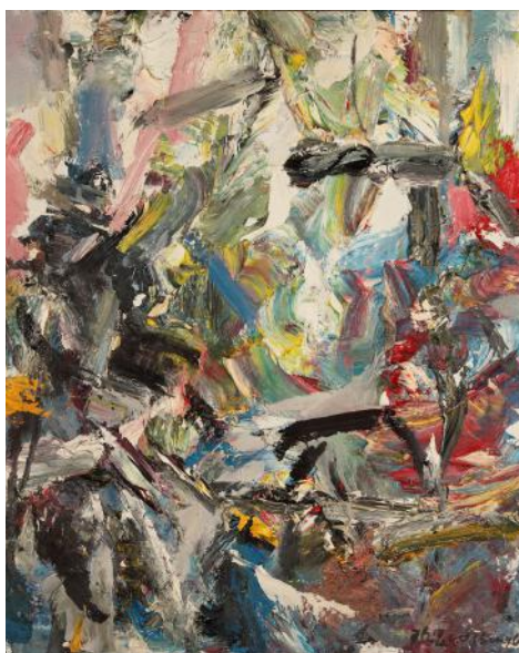
Oeuvre abstraite H19 Huile sur toile 110x90 cm 2016