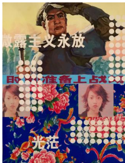
En bas à gauche Nous devons absolument libérer Taiwan N°4 2003 Matériaux synthétiques 90 x 70 cm