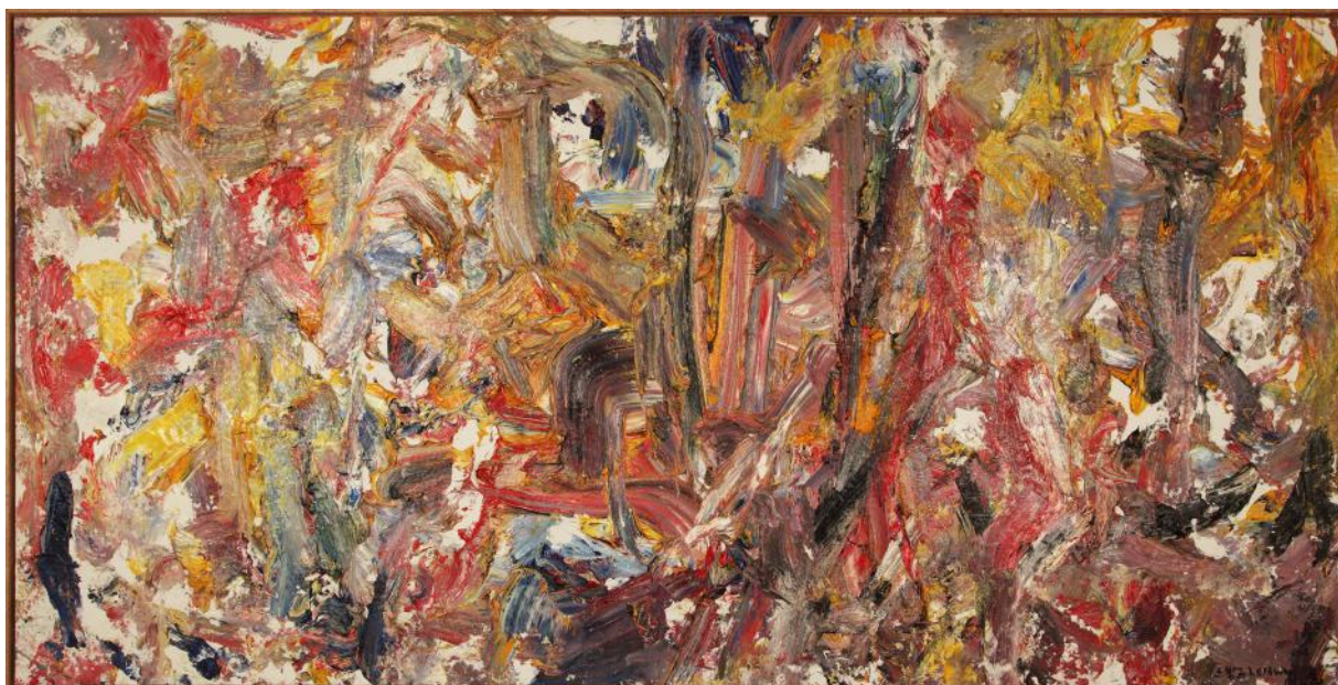
Oeuvre abstrait H14 Huile sur Toile 145x195 cm 2016