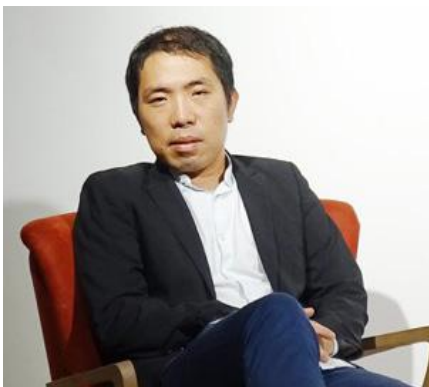
Adao Chen © Adao Chen

Fondateur du Centre Artasia Paris , Adao Chen, installé depuis 2004 à Paris, est un acteur culturel investi et engagé dans l'art contemporain.