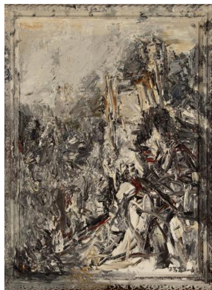
Landscape Revised N°21 Huile sur toile 116x157 cm 2014