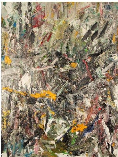
Oeuvre Abstraite H3 Huile sur toile 145x195 cm 2016