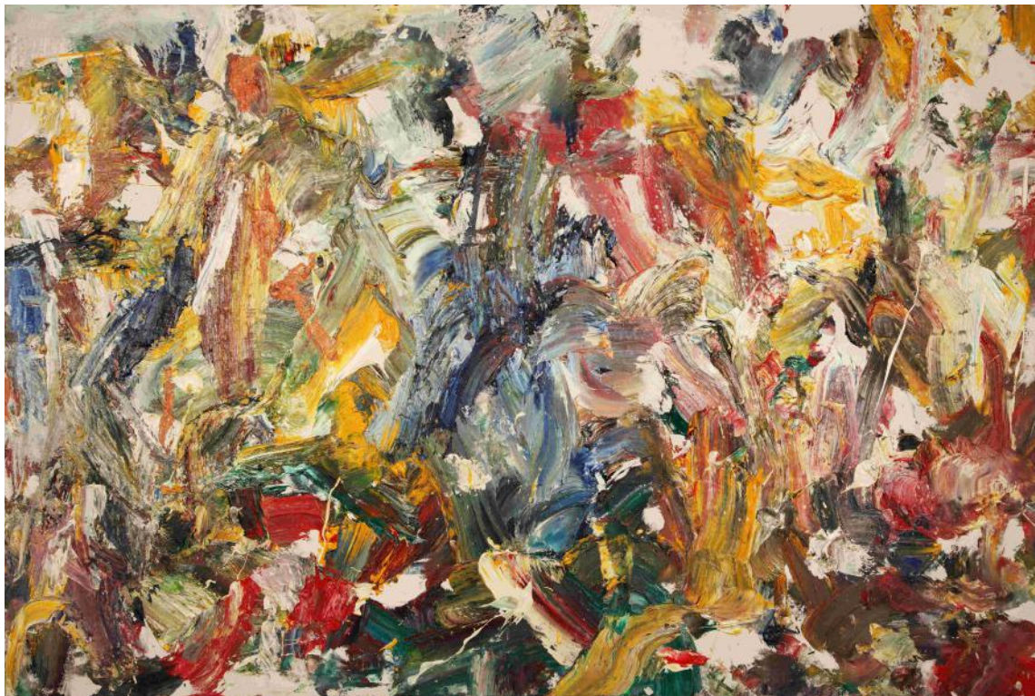
Oeuvre abstrait H7 Huile sur Toile 240x160 cm 2016