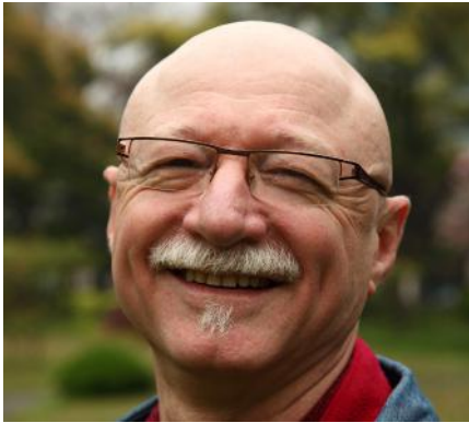
Ami Barak Portrait

Ami Barak est commissaire d'exposition indépendant et critique d'art basé à Paris.