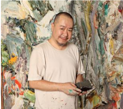
Wang Yigang Portrait © Wang Yigang

Né en 1961 à Qiqihar, Wang Yigang commence sa carrière au début des années 1980, en réalisant, à ses débuts, des œuvres influencées par ses études du cubisme et du futurisme. Lauréat du Encouraging Youth Artist Prize lors du prix National Youth Art Exhibition en 1985, il est diplômé l'année suivante du département de peinture à l'huile de la Lu Xun Academy of Fine Arts de Shenyang.