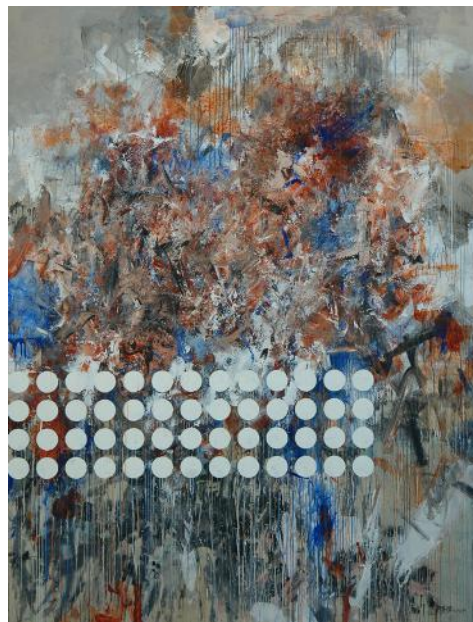
La coloration Gianjiang 2009'2 Toile intégrée 200x260 cm 2009