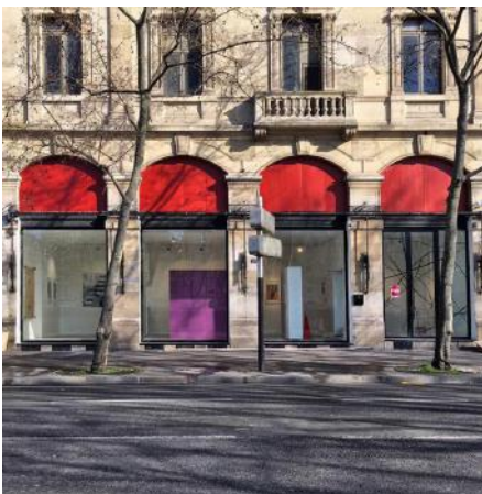
Centre Artasia Paris

Fondé à l'automne 2015, le Centre Artasia Paris est un centre d'art contemporain situé en plein cœur de Paris, quai de la mégisserie, face à la Seine, ayant pour objectif de promouvoir l'art contemporain et la culture asiatique en Europe. Sa salle d'exposition spacieuse et lumineuse, son équipe professionnelle et motivée et les riches contacts noués avec les artistes, les commissaires d'exposition et les collectionneurs sont les éléments majeurs de la réussite des projets innovants et d'avant-garde du centre. Centre Artasia Paris souhaite ainsi à travers cette plate-forme de l'art contemporain développer les échanges artistiques et culturels entre l'Asie et l'Europe.