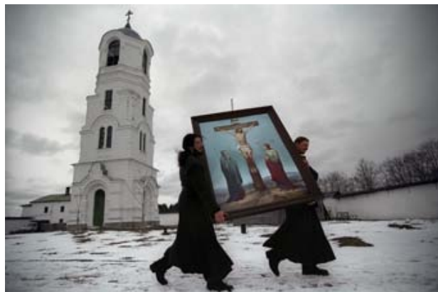
Monastère Alexandro-Svirsky, 2002 80x120 cm, tirage Light Jet