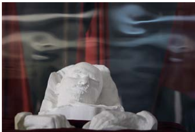
Sergey Maximishin, Masque posthume de Lénine Oulianovsk. 2010. 80x120 cm, tirage Light jet