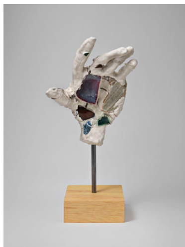
The Grasp and Crumble , Robin Cameron, 2013, 35,5 x 18 x 15 cm