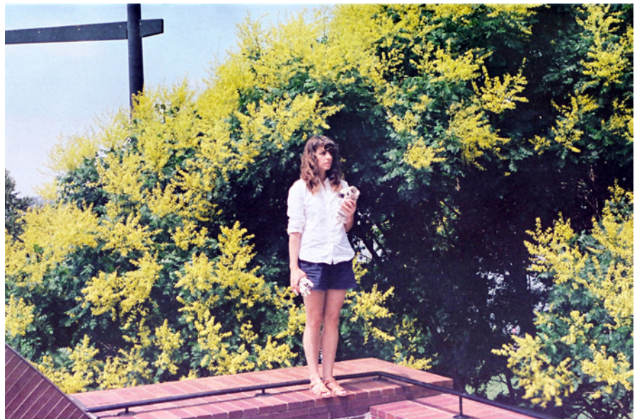
Portrait par Wilson Cameron, 2013