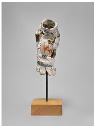
Low Woe Toe , Robin Cameron, 2013, 39,3 x 14 x 14 cm