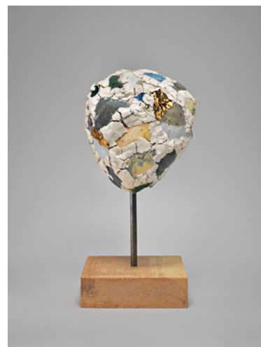
The Last Promise , Robin Cameron, 2013, 33 x 18 x 15 cm