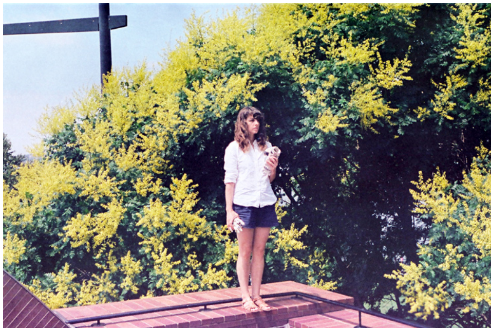
2013