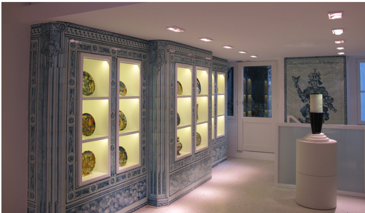
La galerie Lefebvre & Fils, 24 rue du Bac, Paris 7 e

Fondée en 1880 par Henri Lefebvre, la galerie Lefebvre & Fils est spécialisée dans la céramique française et européenne du XVI e au XXI e siècle. Située rue du Bac, au cœur du Paris des conservateurs et des grands collectionneurs d'art et de design, elle a pris part à la formation des plus grandes collections privées et publiques, en France comme à l'international. Forte de son expertise et de sa renommée, la galerie s'est ouverte à la création contemporaine sous l'impulsion de son directeur, Louis Lefebvre.