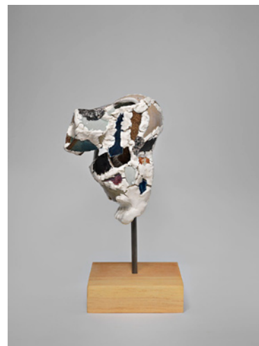
The Flop , Robin Cameron, 2013, 38 x 16,5 x 14 cm