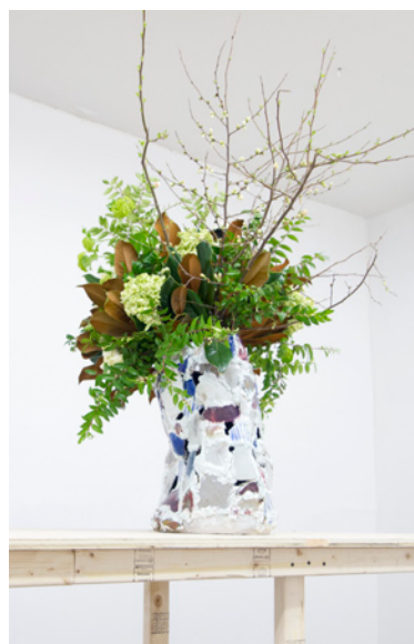
Vayse , Robin Cameron, 2013, 30 x 56 cm