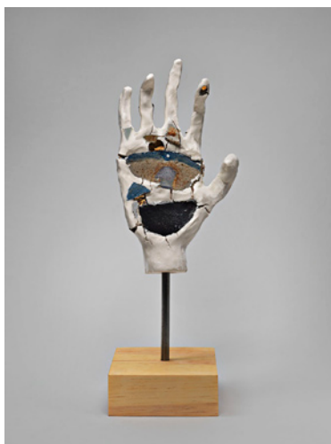
The Worst Stop , Robin Cameron, 2013, 39 x 13 x 13 cm