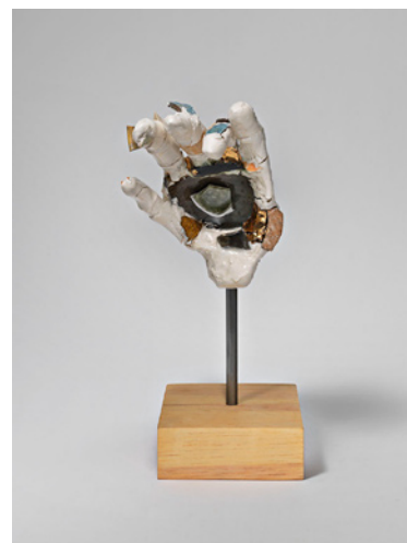
The Let Down , Robin Cameron, 2013, 33 x 11 x 18 cm