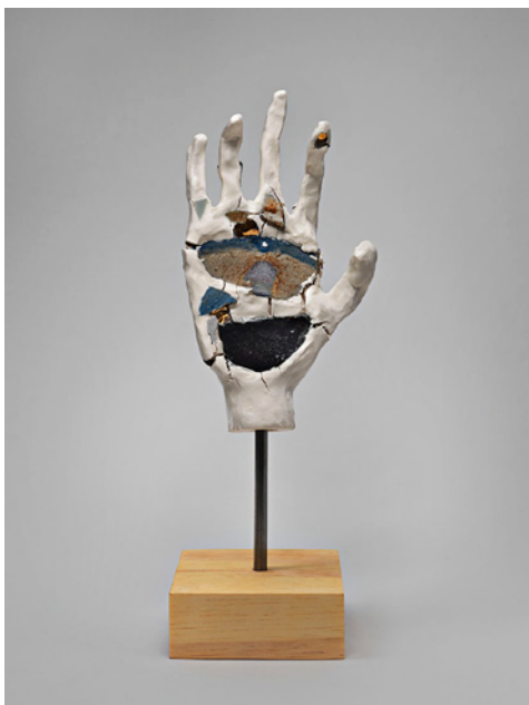
The Worst Stop, Robin Cameron, 2013, 39 x 13 x 13 cm

«J'ai toujours essayé de voir le côté positif de ces objets et de ces situations, utiles et sources de force.»