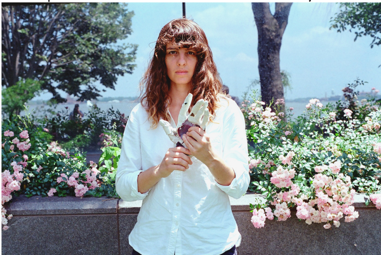
Portrait par Wilson Cameron, 2013

Une exposition inédite du 23 octobre 2013 au 31 janvier 2014