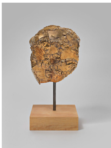
The Gold Debacle , Robin Cameron, 2013, 33 x 15 x 15 cm