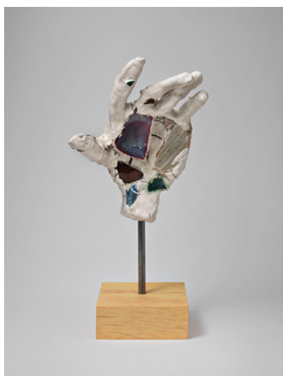
The Grasp and Crumble , Robin Cameron, 2013, 35,5 x 18 x 15 cm

Du 23 octobre 2013 au 31 janvier 2014, la galerie Lefebvre & Fils présente Une Seconde vie de Robin Cameron. Pour sa première exposition en France, Robin Cameron, artiste canadienne, expose son œuvre inédite de céramique.