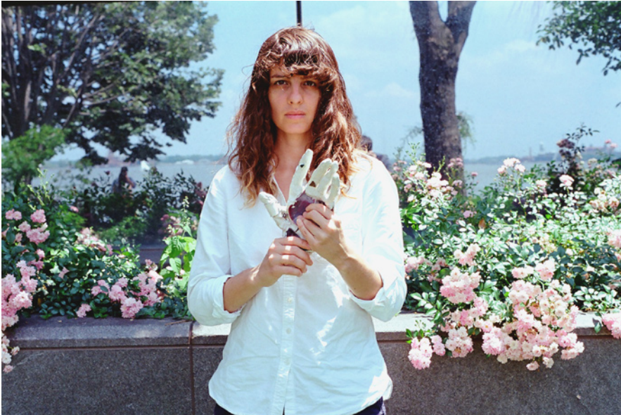
Portrait par Wilson Cameron, 2013