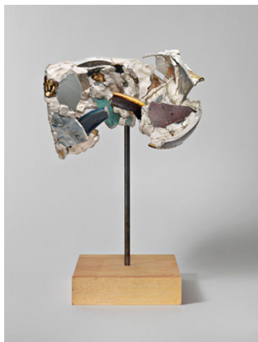
Bail Flail Fail , Robin Cameron, 2013, 40,6 x 24 x 23 cm