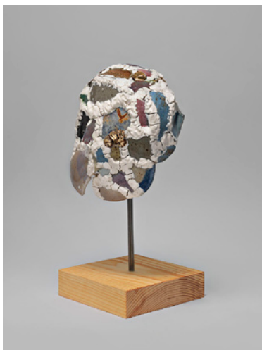
The Slow Downfall , Robin Cameron, 2013, 40,6 x 20 x 18 cm