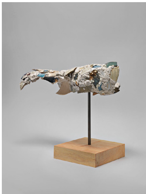
The Slight Misadventure , Robin Cameron, 2013, 33 x 20 x 39 cm

« Les céramiques de Robin Cameron incorporent des formes fragmentées dans un assemblage coloré et disparate. Pour créer ces céramiques, l'artiste a tout d'abord rassemblé des morceaux de poteries délaissés par d'autres. Elle utilise la porcelaine pour combiner les fragments abandonnés créant ainsi de nouvelles formes qui évoquent des morceaux de corps meurtris ou disloqués. Montées sur tige d'acier et reposant sur leurs socles de pin, ces pièces offrent à chaque point de vue une anatomie différente : un masque semble avoir une mâchoire ou un œil, une main révèle sa paume ou des doigts articulés, un pied s'accompagne de sa plante et d'orteils. De la hanche à la tête, des pieds aux doigts, ces nouvelles pièces explorent la figure humaine comme un fragment. Chaque face se juxtaposant à la suivante avec soin. Robin Cameron est fascinée par le concept de l'échec productif, un territoire de conflit dans lequel quelque chose - objet ou idée - qui en lui-même n'est rien d'autre qu'une cause perdue peut trouver un nouveau sens. Ces œuvres sont ce qu'elles ne sont pas supposées être : des fragments re-soudés, des échecs trouvant une nouvelle forme. »