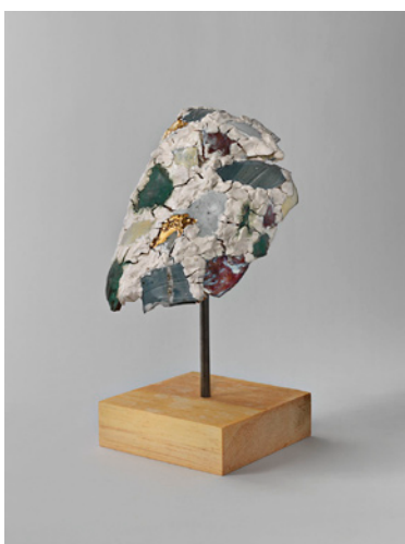
The Loud Defeat , Robin Cameron, 2013, 35,5 x 18 x 20 cm