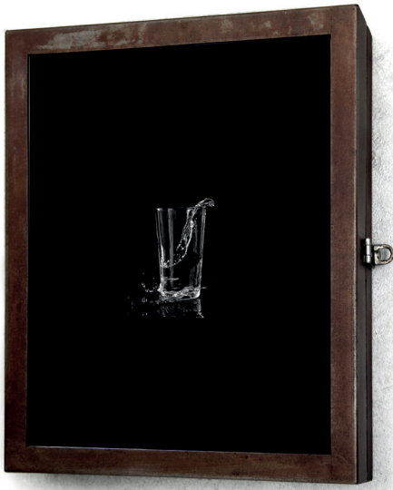
Storm in a Glass , 2014 43 x 38 x 8,5 cm film, boîtier, médias mixés

« Storm in a Glass » représente avec une simple image toute la personnification et la signification d'un moment crucial de l'histoire du pays qui changera peut-être la destinée et le cours de leurs vies.