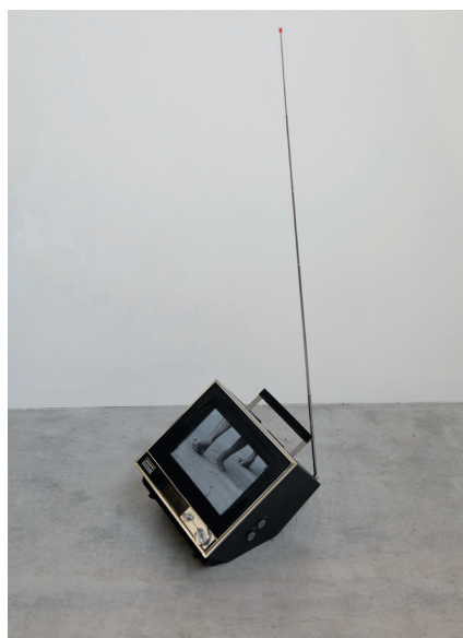
Takuhai su Feet - TV h27 x l28.5 x p26 cm SONY SOLID STATE film, matériaux mixés

La galerie Eric Mouchet est heureuse de présenter l'exposition "HOU-CHOU" releasing birds consacrée à l'artiste japonais Ken Matsubara, du 23 avril au 28 mai 2016.