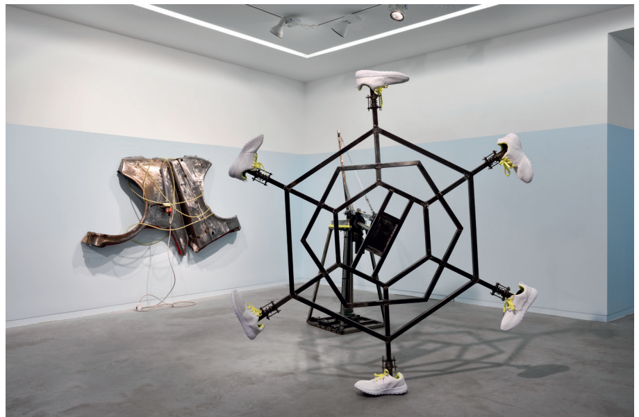
Vue de l'exposition, Pierre Gagnard, 2 Cups Stuffed , 30 Janvier au 5 Mars 2016