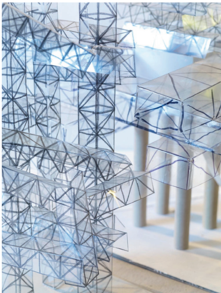
Yona Friedman, Maquette (détail)

EN VENTE CHEZ CORNETTE DE SAINT CYR LE SAMEDI 22 OCTOBRE 2011 A DROUOT-MONTAIGNE