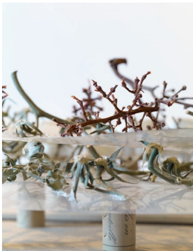
Yona Friedman, Maquette (détail)