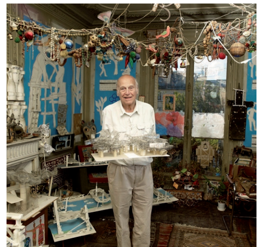
Yona Friedman

« La pensée de Friedman couvre des champs de préoccupation très vastes (...) sa production, au-delà de sa dimension prospective, présente un caractère artistique indéniable. »