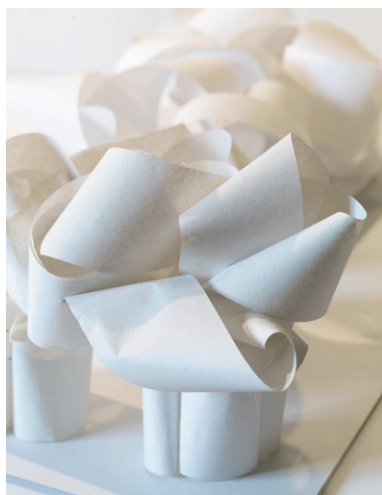
Yona Friedman, Maquette (détail)