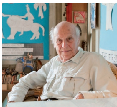
Yona Friedman chez lui, 2009