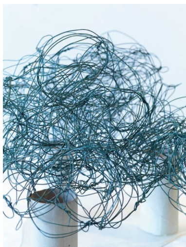
Yona Friedman, Maquette (détail)