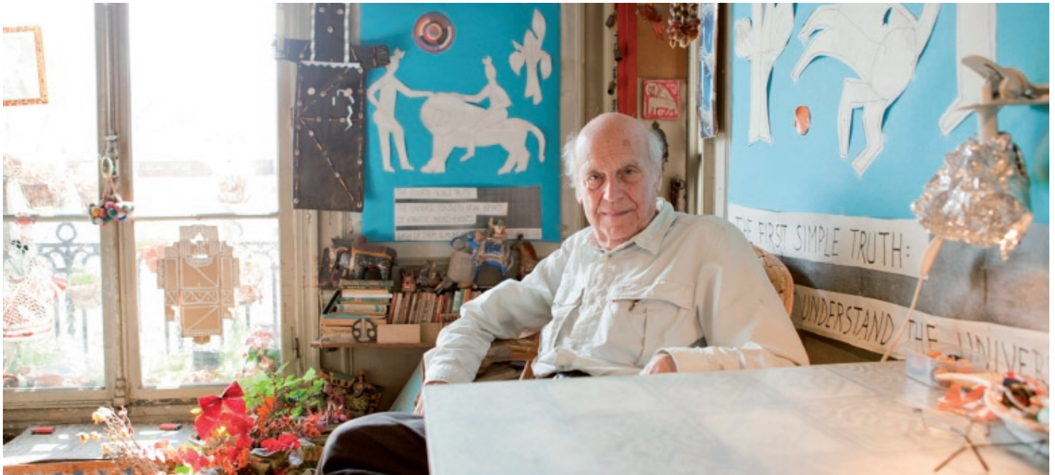
Yona Friedman chez lui, 2009

Né en 1923 à Budapest, Yona Friedman est un architecte français d'origine hongroise, installé à Paris depuis 1957.