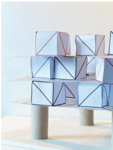
Yona Friedman, Maquette (détail)