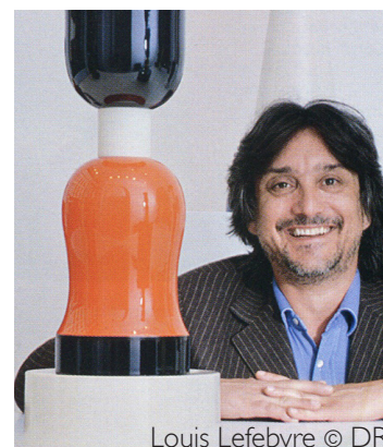
Louis Lefebvre

Depuis l'inauguration de son nouvel espace en 2009, la galerie Lefebvre & Fils s'attache régulièrement à présenter des expositions de grands céramistes contemporains tels, dernièrement, Ettore Sottsass et ses céramiques créées à la Maison Gatti en 2002 ou Enzo Cucchi à qui une exposition sera consacrée à partir du 21 mars 2013.