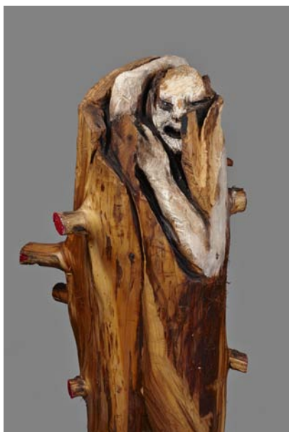
Il était une fois, Le Loup Bois polychrome, 137 x 50 x 65 cm, 2012 © Fabrice Robin