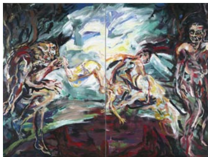
Il était une fois, Le Lièvre de Patagonie Acrylique sur toile, 210 x 280 cm, 2012 © Fabrice Robin

Extrait de Sculpteur de plein air par Françoise Monnin publié dans le Hors série « COSKUN in situ » de la revue Art Absolument, 2008