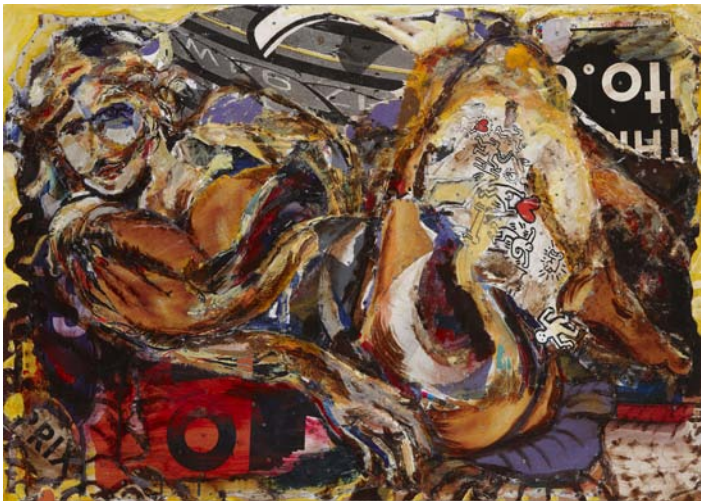
Il était une fois , Keith Haring, Acrylique, affiche, vis, sur contreplaqué, 87 x 122 cm, 2012, © Fabrice Robin