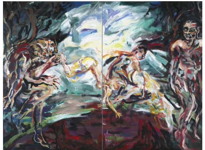
Il était une fois, Le Lièvre de Patagonie , Acrylique sur toile, 210 x 280 cm, 2012, © Fabrice Robin