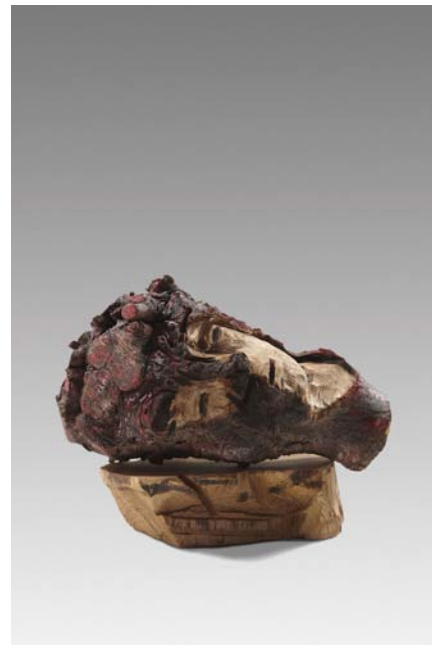
Il était une fois, Tête couchée Bois polychrome, 42 x 26 x 22 cm, 2012 © Fabrice Robin