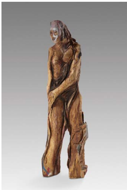
Il était une fois, Femme d'Ali Bois polychrome, 150 x 50 x 30 cm, 2012 © Fabrice Robin