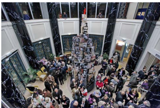
Exposition Jef Aérosol - Janvier 2011