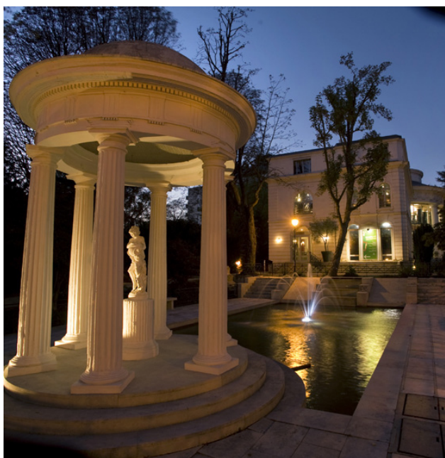
Vue du musée des Avelines

Musée des Avelines Musée d'art et d'histoire de Saint-Cloud