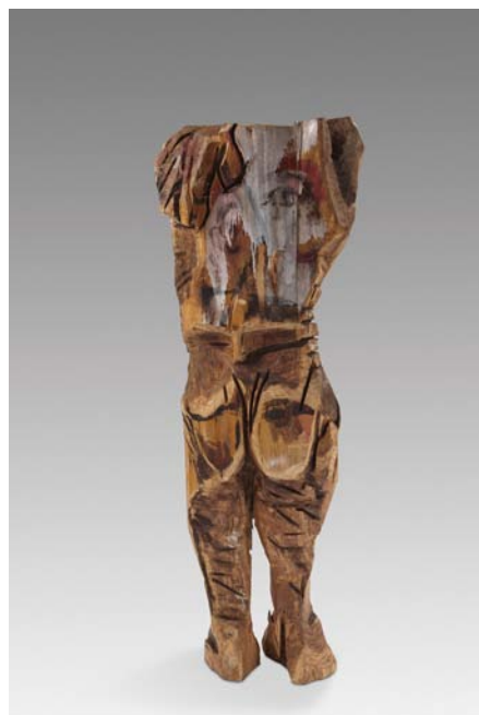
Il était une fois, Ali et sa belle Bois polychrome, 139 x 52 x 48 cm, 2012 © Fabrice Robin