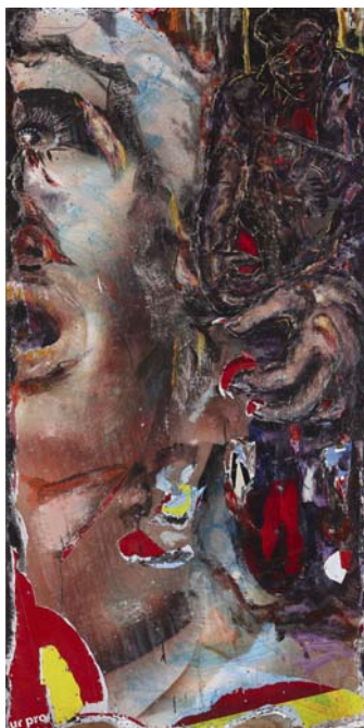
Il était une fois, Je me fais du cinéma , Acrylique, affiche, vis, sur contreplaqué, 196 x 97 cm, 2012, © Fabrice Robin