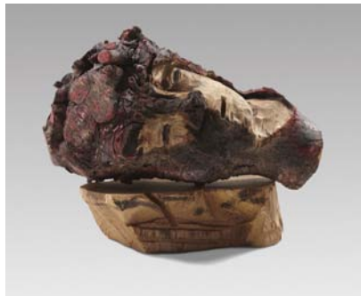
Il était une fois , Tête couchée, Bois polychrome, 42 x 26 x 22 cm, 2012 © Fabrice Robin