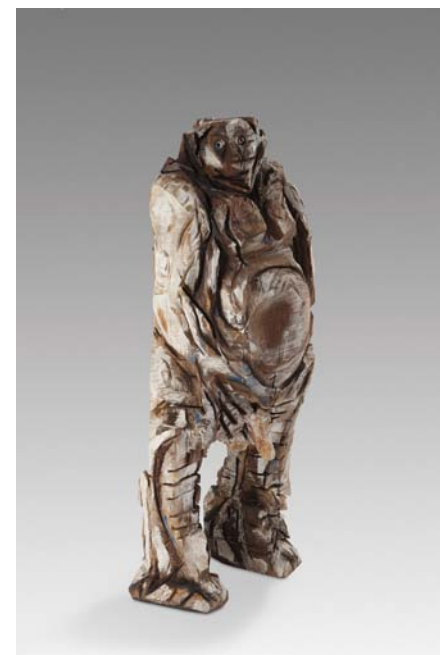
Il était une fois, Perrault Bois polychrome, 125 x 40 x 55 cm, 2012 © Fabrice Robin