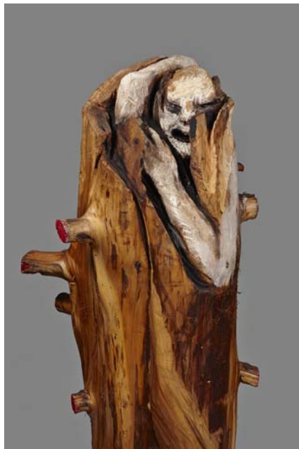
Il était une fois, Le Loup Bois polychrome, 137 x 50 x 65 cm, 2012 © Fabrice Robin