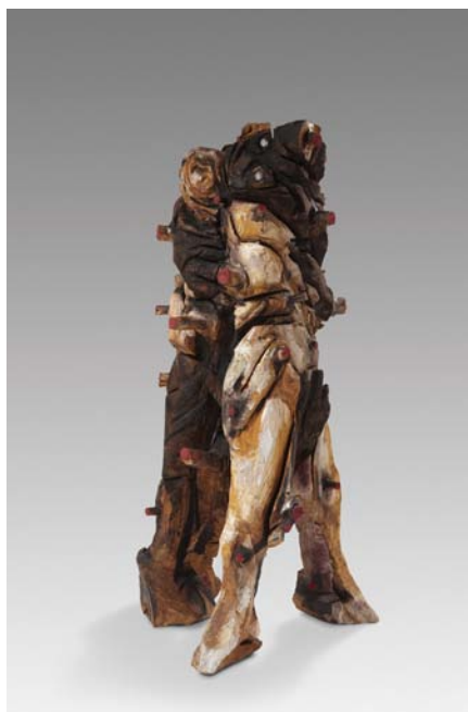
Il était une fois, La Belle et la Bête Bois polychrome, 133 x 70 x 60 cm, 2012 © Fabrice Robin