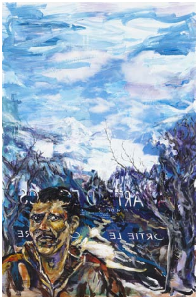
Il était une fois, Jo Acrylique sur toile, 210 x 140 cm, 2012

Pour cette exposition, les œuvres de COSKUN investissent tous les espaces du musée et sont mises en scène pour entraîner le visiteur dans une histoire. La plupart d'entre elles ont été réalisées spécialement pour cette exposition autour d'un thème choisi par l'artiste : Il était une fois . S'inspirant de la version du conte du Petit Chaperon rouge de Perrault, qui, selon un historien, aurait trouvé sa source dans un fait divers ayant eu lieu dans le bois attenant à la maison de l'artiste, COSKUN propose une série d'œuvres autour de ce sujet qui constitue la trame de l'exposition.