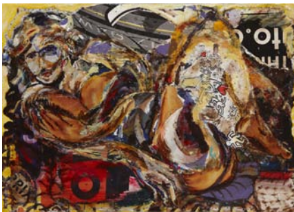
Il était une fois, Keith Haring, Acrylique, affiche, vis, sur contreplaqué, 87 x 122 cm, 2012