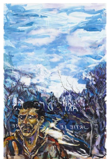
Il était une fois, JO , Acrylique sur toile, 210 x 140 cm, 2012, © Fabrice Robin