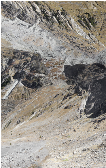
Benoît Vollmer, Sans titre #5

VERNISSAGE LE SAMEDI 24 OCTOBRE 2015 DE 18H À 21H