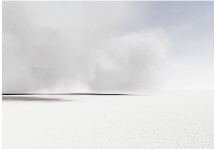
Mathieu Bernard-Reymond, Clo_ds II , de la série Interruption , 2014

Du 24 octobre au 28 novembre 2015, la galerie Eric Mouchet présente l'exposition Eléments , carte blanche au photographe et commissaire d'exposition Matthieu Gafsou.