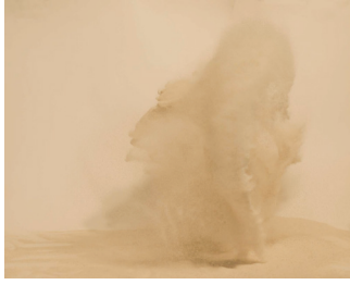
Benoît Jeannet, série A Geological Index of The Landscape

Dans Interruption , Mathieu Bernard-Reymond suspend le calcul d'un logiciel de fabrication de paysages en 3D, laissant visibles les artefacts du processus en action par des formes polygonales. L'artifice, ainsi dévoilé, s'inscrit dans le paysage sans toutefois ébranler l'effet de réel.