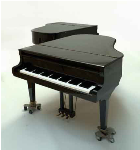
Tal Isaac Hadad, Deux pianos à queue modifiés Dimension pour un piano : l.160 x h.160 x L.200 cm © Tal Isaac Hadad

Deux pianos à queue modifiés installés au pied de l'escalier d'honneur du Grand Palais Trois performances (30 min) les 19, 20 et 21 octobre 2012