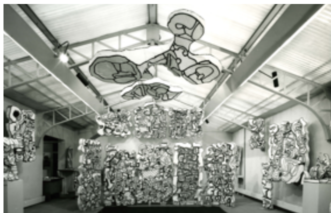
Vue de l'exposition Jean Dubuffet à la galerie en 1968