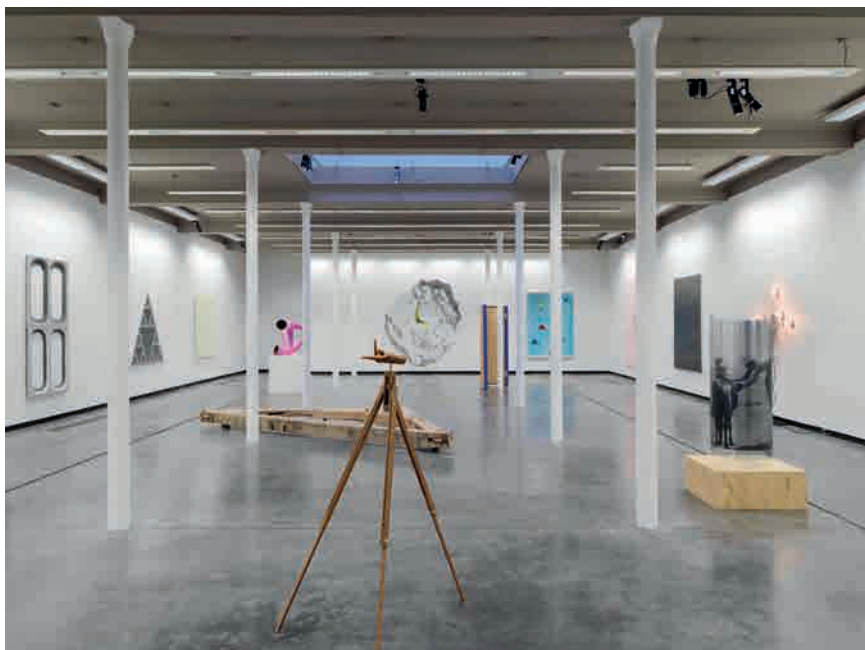
Vue de l'exposition inaugurale de la rue du Mail

Le 4 février 2016, la Galerie Triple V a inauguré son second espace d'exposition au 5, rue du Mail, dans le 2 ème arrondissement de Paris, à deux pas de la Place des Victoires.