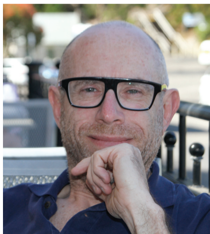
Eric Mouchet portrait