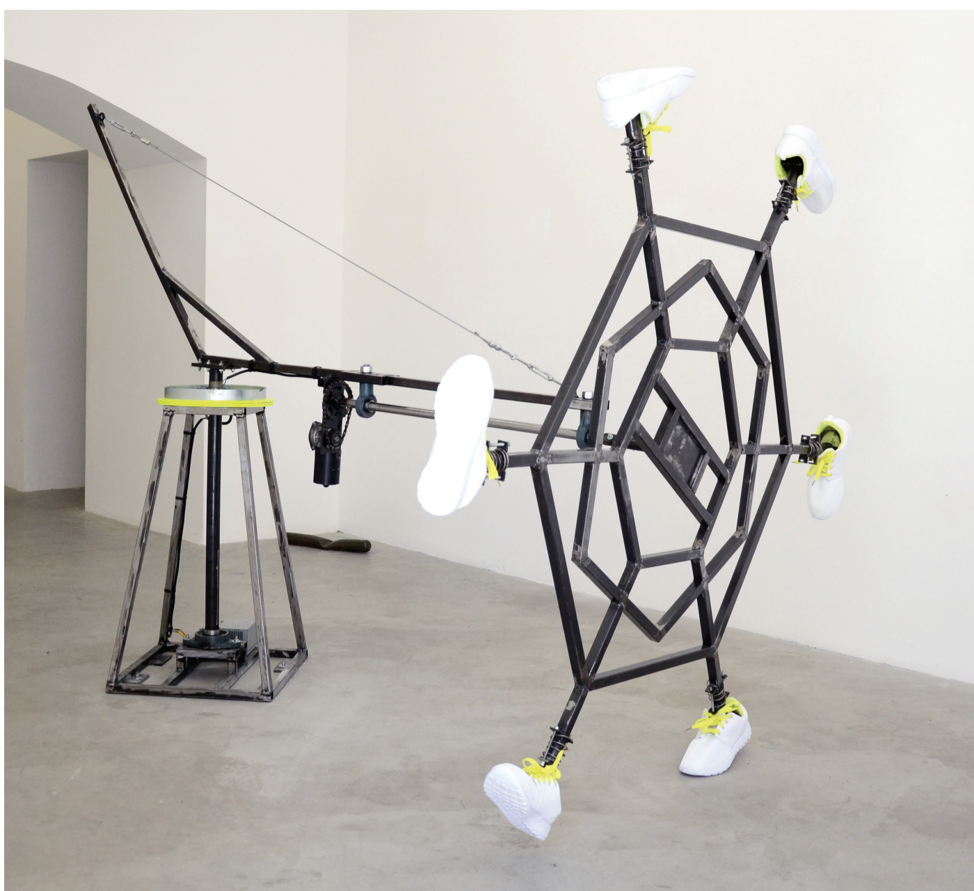
Mouvement vers une sémantique de Fils2pute (D'après Adidas Lab), 2015 Métal brossé, vernis, roulements à billes, moteur d'essuies-glaces, alimentation électrique 12V 20 AMP, câbles 6MM, tendeurs, ressorts, baskets, 350X350X200 cm

VERNISSAGE LE SAMEDI 30 JANVIER DE 18H À 21H