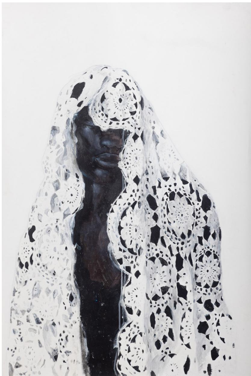
Le poids de la mémoire #1, 109,5 x 75 cm, 2022