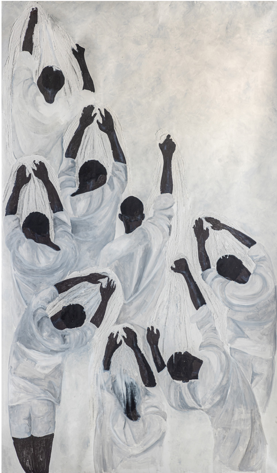
La grande espérance , 306 x 180,5 cm, 2022