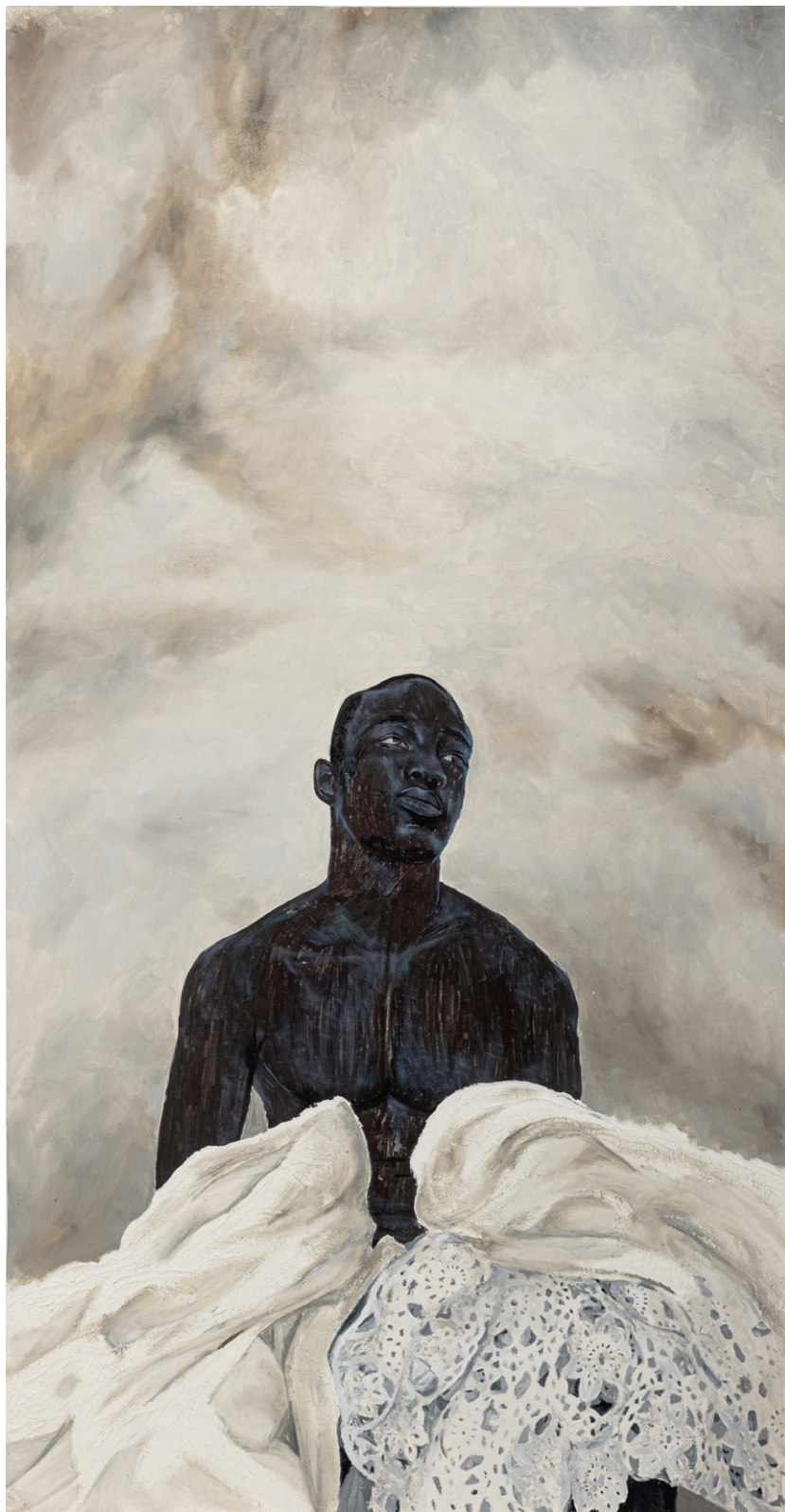
À mes yeux , 195,5 x 101,5 cm, 2022