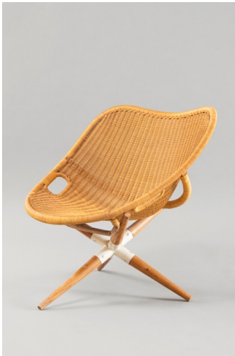
Fauteuil Tripode , Joseph-André Motte. Edition Rougier 1949.