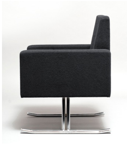
Fauteuil Luge , Joseph-André Motte. Circa 1960. Courtesy Galerie Pascal Cuisinier