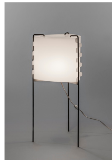
Lampadaire M4 , Joseph-André Motte. Edition les Huchers, 1958.

(Tous ces visuels sont disponibles pour la presse)