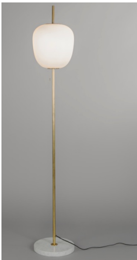
Lampadaire J14 , Joseph-André Motte. Edition Pierre Disderot, 1957.