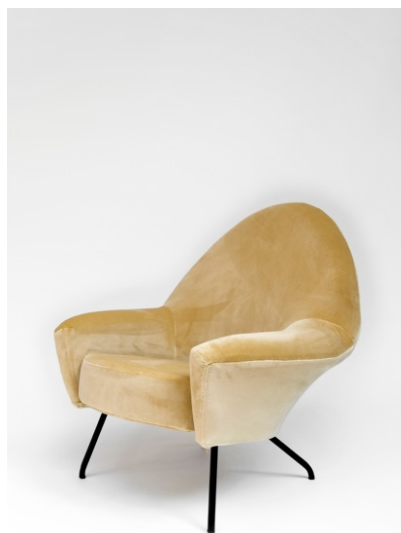
Fauteuil 770 , Joseph-André Motte. Edition Steiner, 1958.