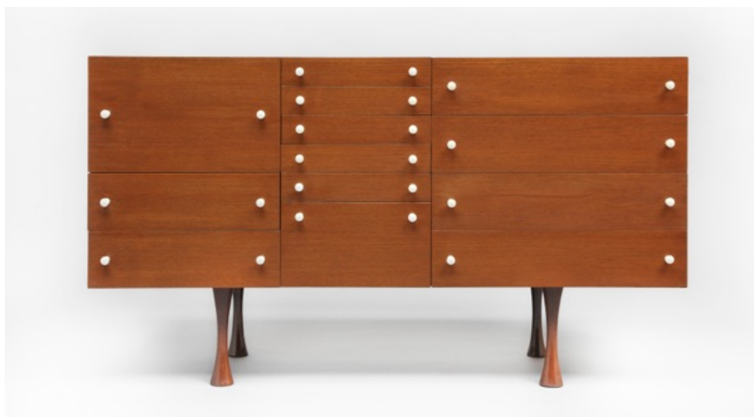
Commode Evelynne, Joseph-André Motte. Edition Charron, 1959. Courtesy Galerie Pascal Cuisinier

L'hommage à Joseph-André Motte orchestré par la galerie Pascal Cuisinier du 17 au 22 juin 2014 à Bâle se poursuivra à Paris, dans l'espace d'exposition de la galerie Pascal Cuisinier à Saint-Germain-des-Près, du 26 juin au 30 août 2014.