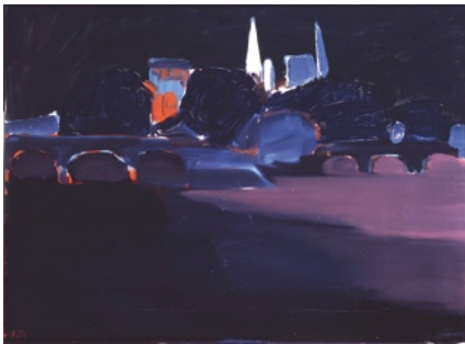
Le Pont Marie, 1954