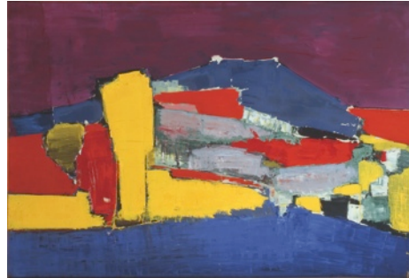
La Montagne Sainte-Victoire (Paysage de Sicile), 1954