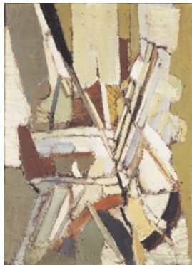
Jour de fête, 1947