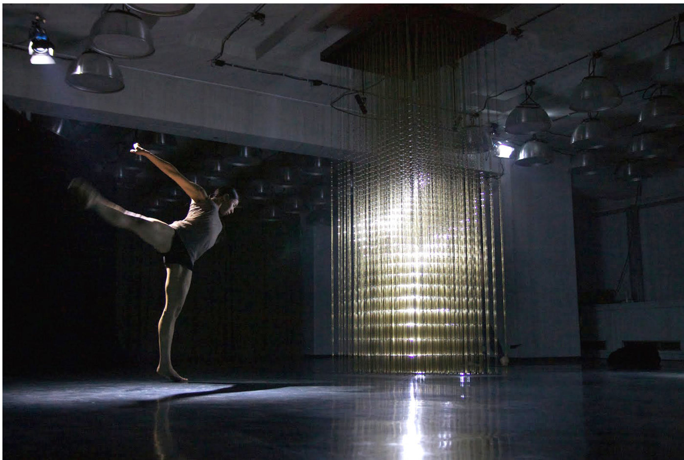
Future Self , 2012. Aluminium, LEDs, tiges de laiton.