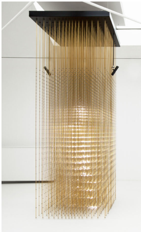
Future Self, 2012. Aluminium, LEDs, tiges de laiton.