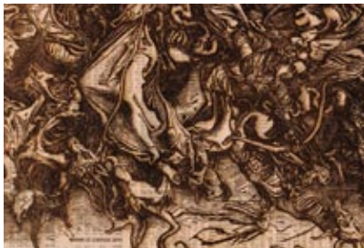
Revelation XI, 2009 - Pyrogravure sur contreplaqué, 32,5 x 24,5 cm (détail)

Room Art Space, Londres présente Gordon Cheung www.roomartspace.co.uk