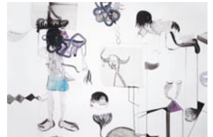
Ne vois-tu rien venir ?, 2010 - Aquarelle et encre de Chine sur papier, 140 x 200 cm - Courtesy Ladiray Gallery

Ladiray Gallery, Londres présente Vincent Bizien www.jeromeladiray.com