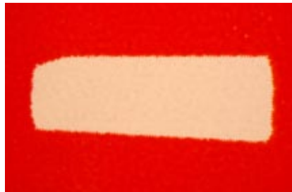
Gift de la série Zizou, 2007 - Objet photographique, 22 x 30 cm - Courtesy Galerie Russiantearoom

Russiantearoom, Paris présente Dmitry Sokolenko www.rtrgallery.com