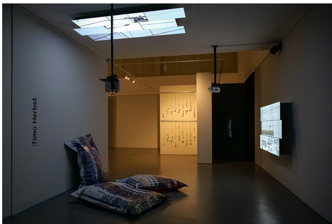
Shanghai Cables (Pt. 1 & Pt. 2), Timo Herbst, 2021, Installation vidéo multicanale interactive, 4K

Projection des films expérimentaux et courts métrages de la collection Light Cone, suivie d'une discussion