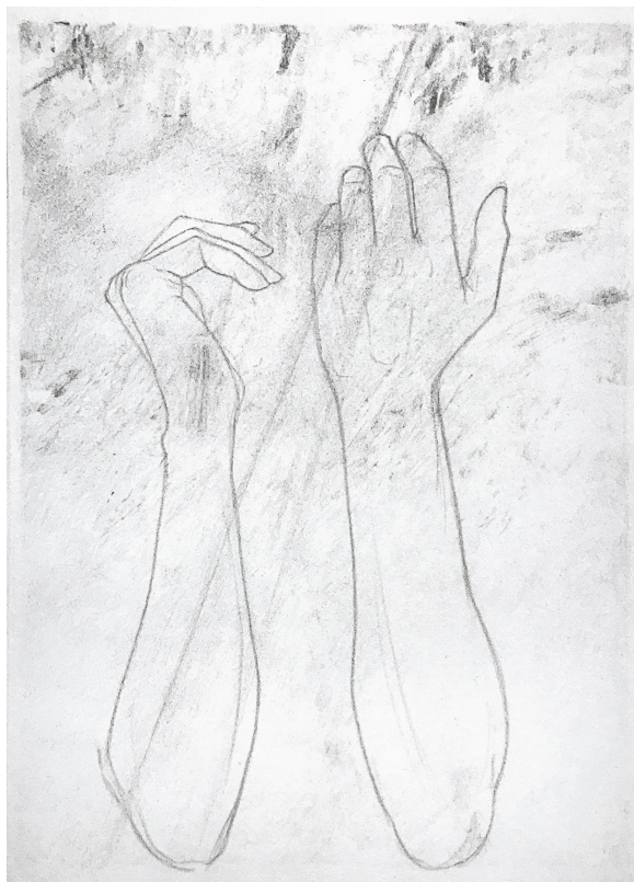
One of All , Timo Herbst, 2022, © Timo Herbst

EXQUISITE BODY invite ainsi à repenser le corps comme une instance à la fois sensible, agissante et porteuse de mémoire. Les gestes de marche, de résistance ou de rassemblement y sont analysés comme de véritables chorégraphies sociales, révélant les interactions étroites entre corporalité, architecture et espace public. Son travail met en lumière la manière dont ces dynamiques