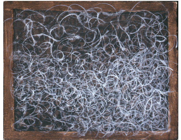
Sans titre, 1690-1962