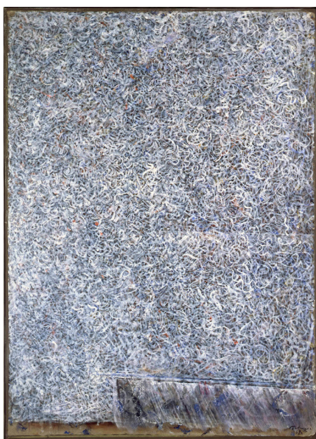
Escape From Static , 1968 Tempera sur papier marouflé sur panneau-67 x 48 cm © Veignant