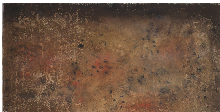
Sanstitre , 1961 - Monotype - 48,5x99cm