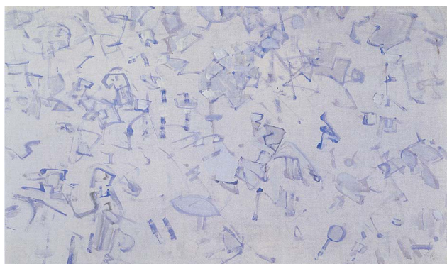
Rive gauche , 1955 - Tempera sur papier-61 x 91 cm

Toutes les images figurant dans ce dossier sont à créditer, sauf indication contraire : Courtesy Galerie Jaeger Bucher et Jeanne Bucher, Paris