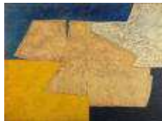
Serge Poliakoff La Table d'Or , 1950 97 x 130 cm Tefaf 2008