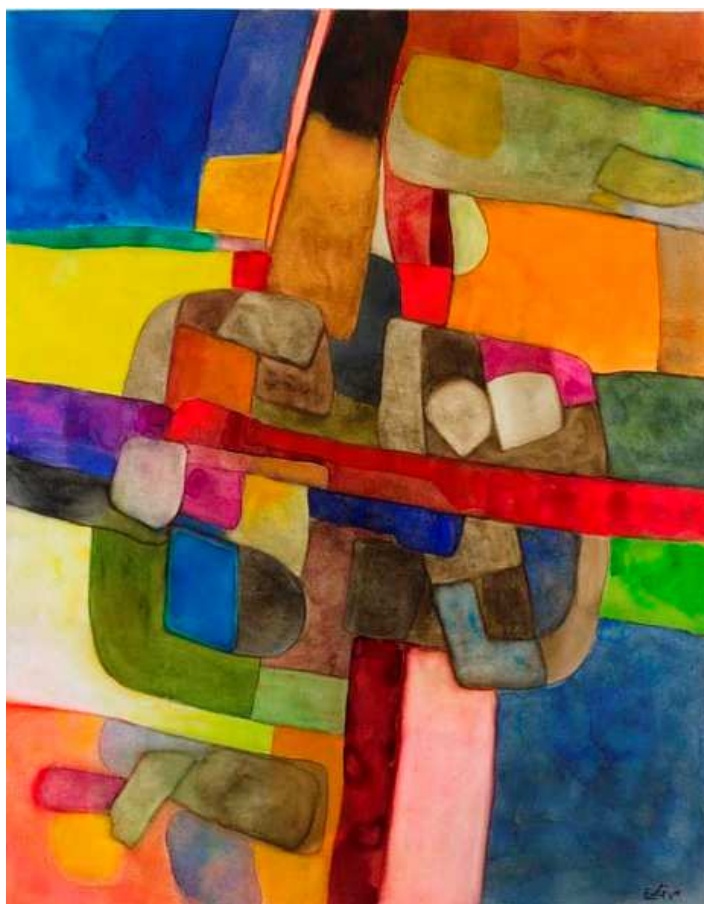
A-1068, 1972 Aquarelle sur papier Signée en bas à droite 63,4 x 49,7 cm

APPLICAT-PRAZAN Rive gauche 16 rue de Seine – 75006 Paris