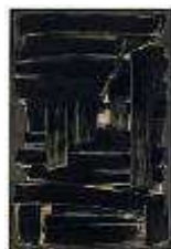
Pierre Soulages Peinture 195 x 130 cm, 1 er sept. 1957 Fiac 2009