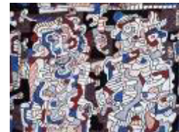
Jean Dubuffet Epoux en visite , 1964 200 x 150 cm Biennale 2010