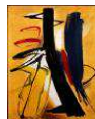
Hans Hartung T 1938-11 , 1938 102 x 80 cm Fiac 2011