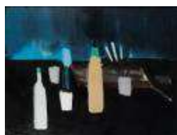
Nicolas de Staël La Table de l'Artiste , 1954 89 x 116 cm Biennale 2008

Certaines peintures ont été particulièrement remarquées ces dernières années. Citons par exemple :