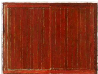
Sans titre , 1980 Peinture sur papier 24 x 31 cm