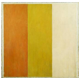
Sans titre , 1985 Peinture sur toile 200 x 200 cm