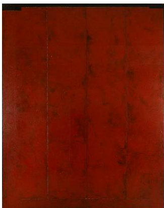
Sans titre (Palissade), 1979 Peinture sur toile 230 x 178 cm