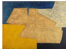
Serge Poliakoff La Table d'Or , 1950 97 x 130 cm Tefaf 2008