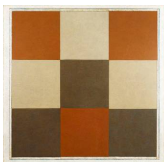
Sans titre , 1989 Peinture sur toile 200 x 200 cm