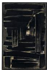
Pierre Soulages Peinture 195 x 130 cm, 1 er sept. 1957 Fiac 2009