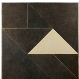
Sans titre (Triangle) , 1982 Peinture sur toile 150 x 150 cm