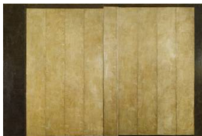
Sans titre (Diptyque), 1977 Peinture sur toile 250 x 360 cm