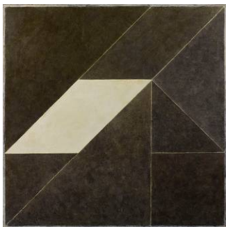
Sans titre (Parallélogramme) , 1981-82 Peinture sur toile 150 x 150 cm