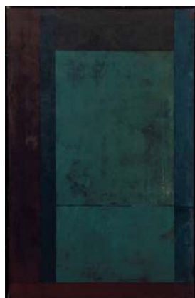
Sans titre, 1978 Peinture sur toile 250 x 160 cm