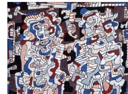
Jean Dubuffet Epoux en visite , 1964 200 x 150 cm Biennale 2010

L'exposition Schneider, Œuvres majeures autour d'un tableau d'exception , présentée à la FIAC 2006 a connu un grand succès; en mai 2007, Applicat-Prazan a présenté à la galerie, Mes années 50, Collection Alain Delon ; en septembre 2007, l'exposition Présence, silences, hommage à Geer van Velde a permis de redécouvrir la palette subtile de ce grand peintre; en mars-avril 2008, l'exposition Poliakoff aura sans doute marqué un jalon dans la trajectoire de l'Artiste au plan du marché de l'Art international, tout comme l'exposition Atlan organisée d'octobre à décembre 2008, en concomitance avec la monstration de la dation éponyme au Centre Pompidou. Dialogues I Autour de Pierre Soulages a marqué, d'octobre à décembre 2009, une étape importante dans la vie de la galerie.