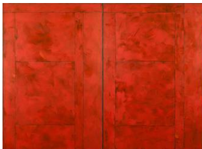
Sans titre (Diptyque), 1977 Peinture sur toile 195 x 260 cm