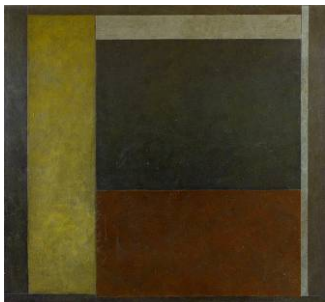
Sans titre, 1979 Peinture sur toile 130 x 140 cm