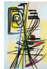
Hans Hartung T 1947 - 12 , 1947 146 x 97 cm Fiac 2009