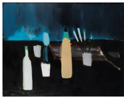
Nicolas de Staël La Table de l'Artiste , 1954 89 x 116 cm Biennale 2008

Certaines œuvres ont été particulièrement remarquées ces dernières années. Citons par exemple :