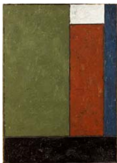
Sans titre , 1976 Peinture sur papier marouflé sur toile 36 x 26 cm