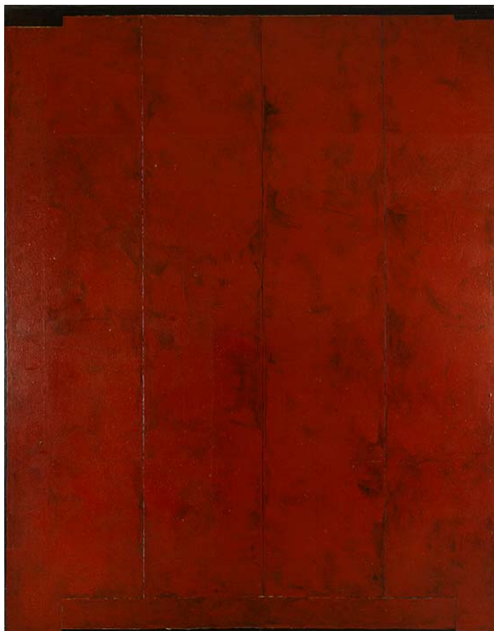
Sans titre (Palissade), 1979 Peinture sur toile 230 x 178 cm