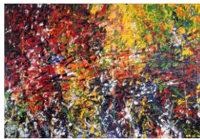
Jean-Paul Riopelle Hommage à Robert le Diabolique 1953, 200 x 282 cm Tefaf 2010