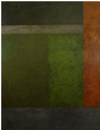
Sans titre, 1979 Peinture sur toile 223 x 171 cm