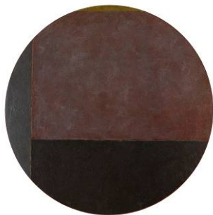
Sans titre (Tondo), 1979 Peinture sur toile Ø120 cm