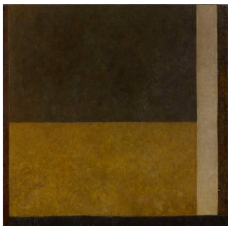
Sans titre, 1979 Peinture sur toile 153 x 153 cm