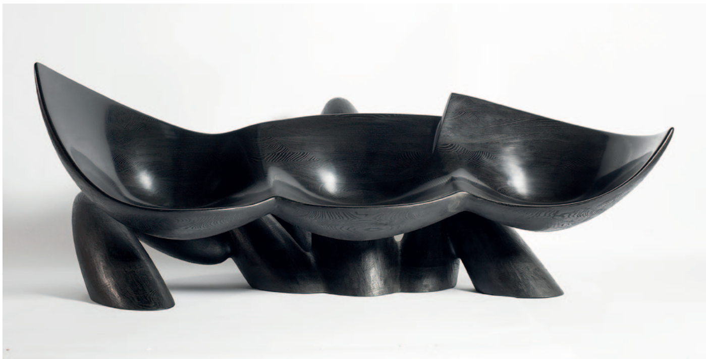
WENDELL CASTLE | SIXTEEN HUNDRED 2013, FRÈNE TEINTÉ, FINITION HUILÉE, H90.8 L246.4 W140.3 CM / H35.7 L97 W55.2 IN, UNIQUE

Pour sa deuxième participation à la Biennale des Antiquaires, Carpenters Workshop Gallery proposera sur son stand des œuvres inédites du designer américain Wendell Castle, présentées au cœur d'une scénographie de l'artiste française Ingrid Donat.