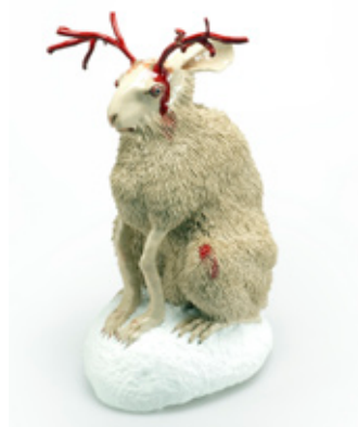
Carolein Smit, White Hare , 2011 Céramique, Hauteur: 45 cm

Parmi ces exposants, six jeunes galeries de moins de 4 ans, sélectionnées par un comité de sélection international prestigieux, formeront la section Emergence de la foire, une section créée en 2010 qui reflète l'attachement de la foire à la jeune scène artistique contemporaine.