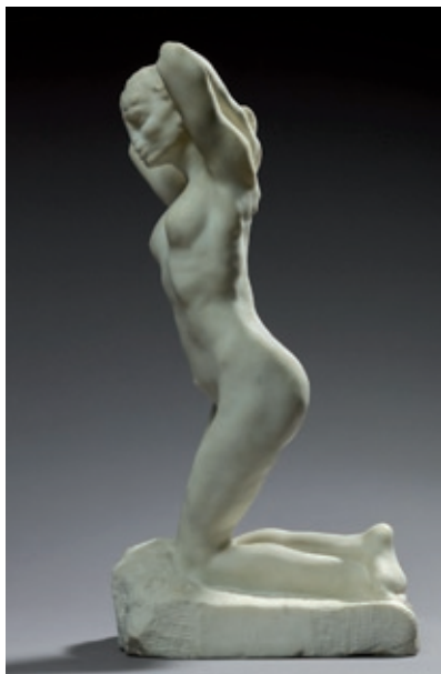
Auguste Rodin (1840 -1917) Faunesse à genoux Marbre signé et dédié sur la base « Au Maître Puvis de Chavannes » Conçue en 1887, cette version en marbre exécutée vers 1890 Donnée par Rodin à Puvis de Chavannes probablement en août 1890 Hauteur : 55 cm Estimation : 600 000 / 800 000 €

Cette pièce dégage à la fois une grande force et une extrême sensualité (...)